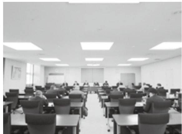
(下越：新潟ユニゾンプラザ)