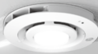
人感センサー内蔵形(照明付)