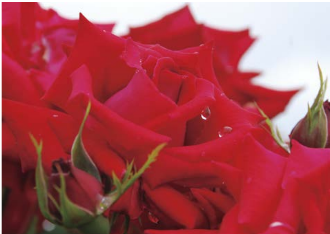
国営越後丘陵公園のばら