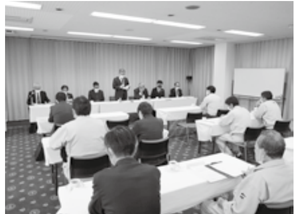
(上越：上越サンプラザホテル)