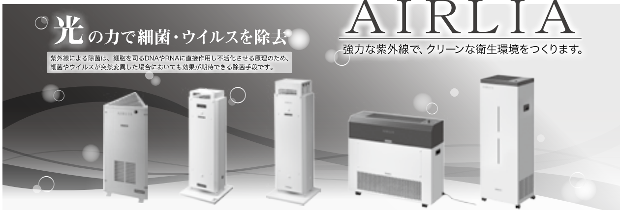
エアーリア デルタ