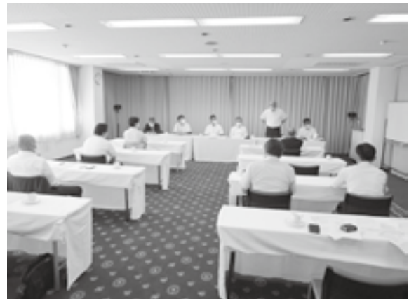
(上越：上越サンプラザホテル)

(※) 第2回ブロック会議は、新型コロナウイルスの感染拡大防止のため、中止としました。