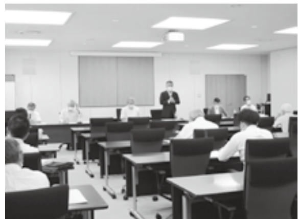
(下越：新潟ユニゾンプラザ)