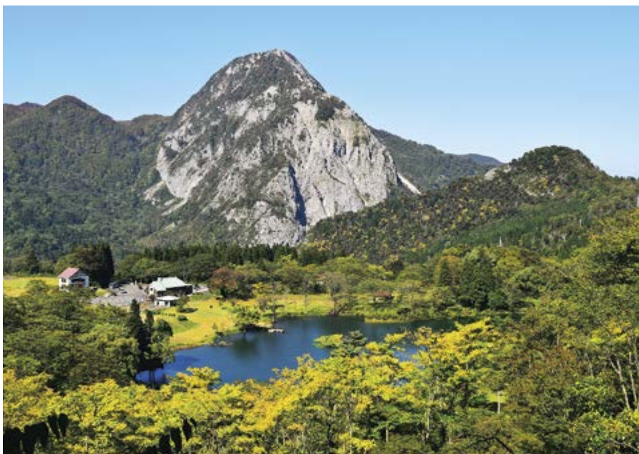
明星山と四季を通して美しい景観を見せる高浪の池（糸魚川市）