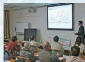
お客様向け合同説明会